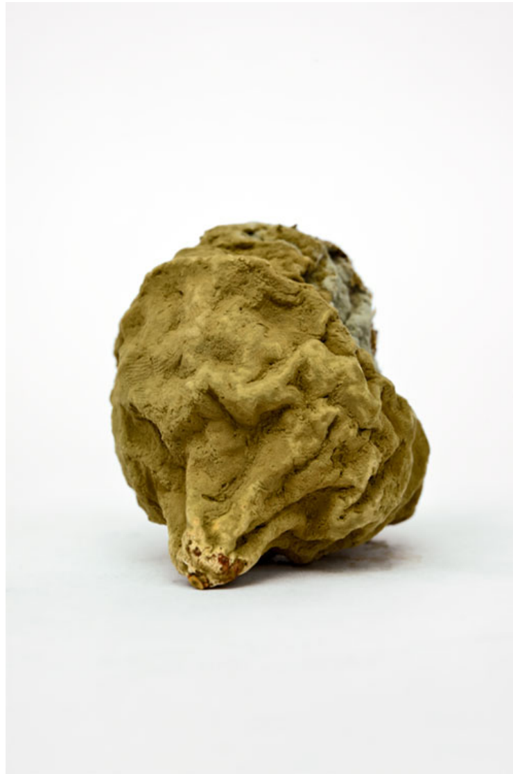
Citron 2016 format (max 90 x 60 cm )