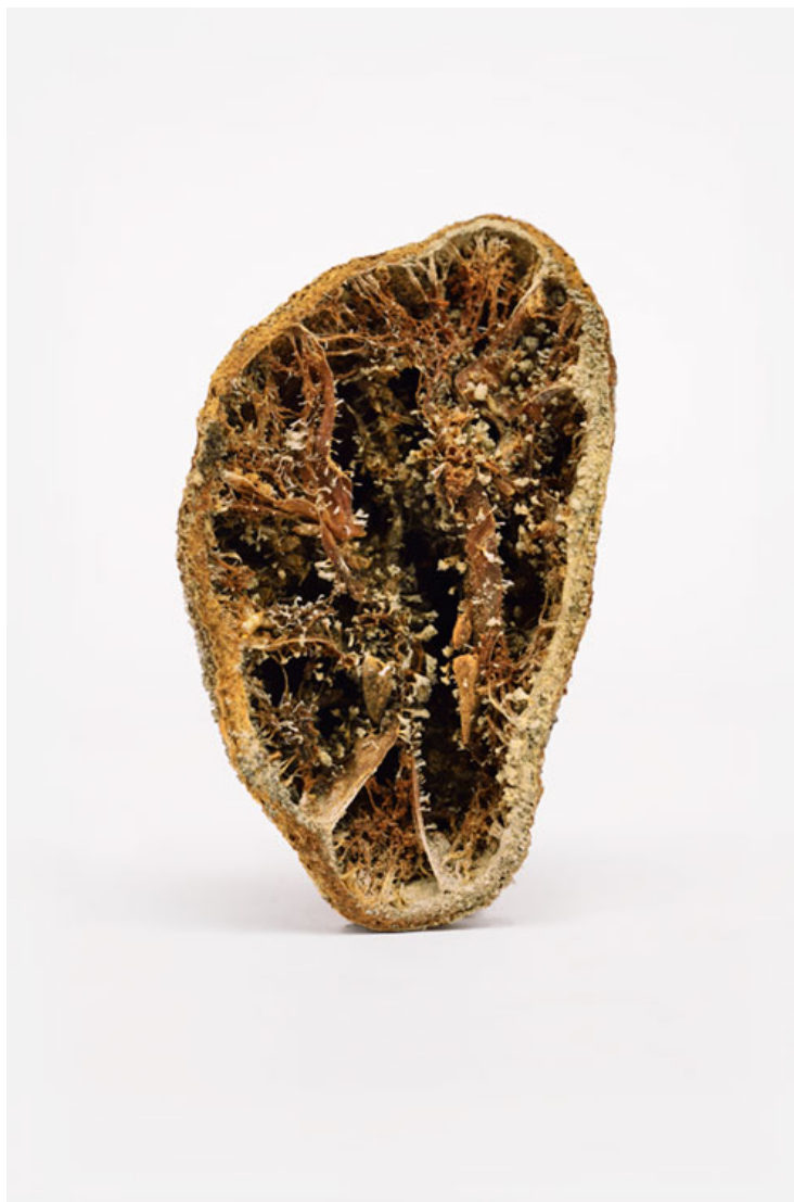
citron tranché 2016 format (max 90 x 60 cm )