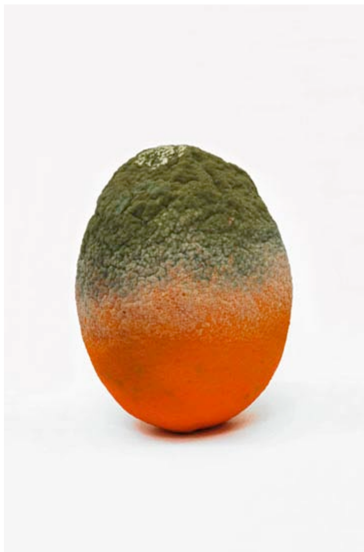
Orange 2014 format (max 90 x 60 cm )