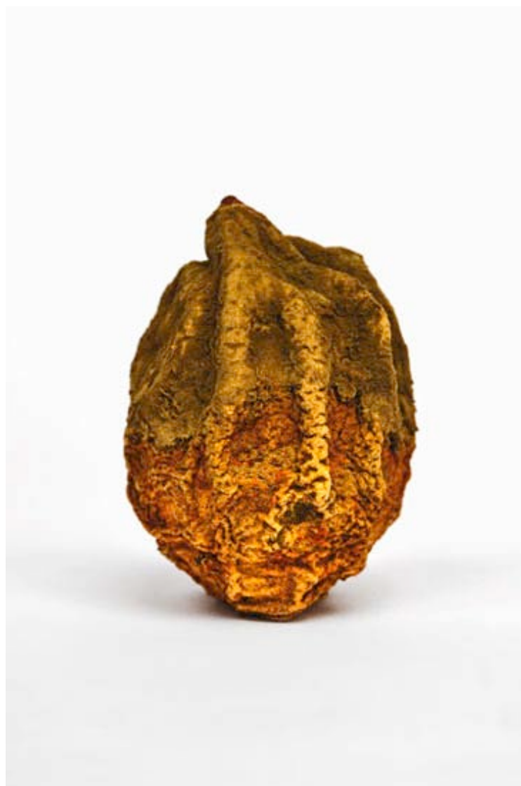
Citron 2016 format (max 90 x 60 cm )