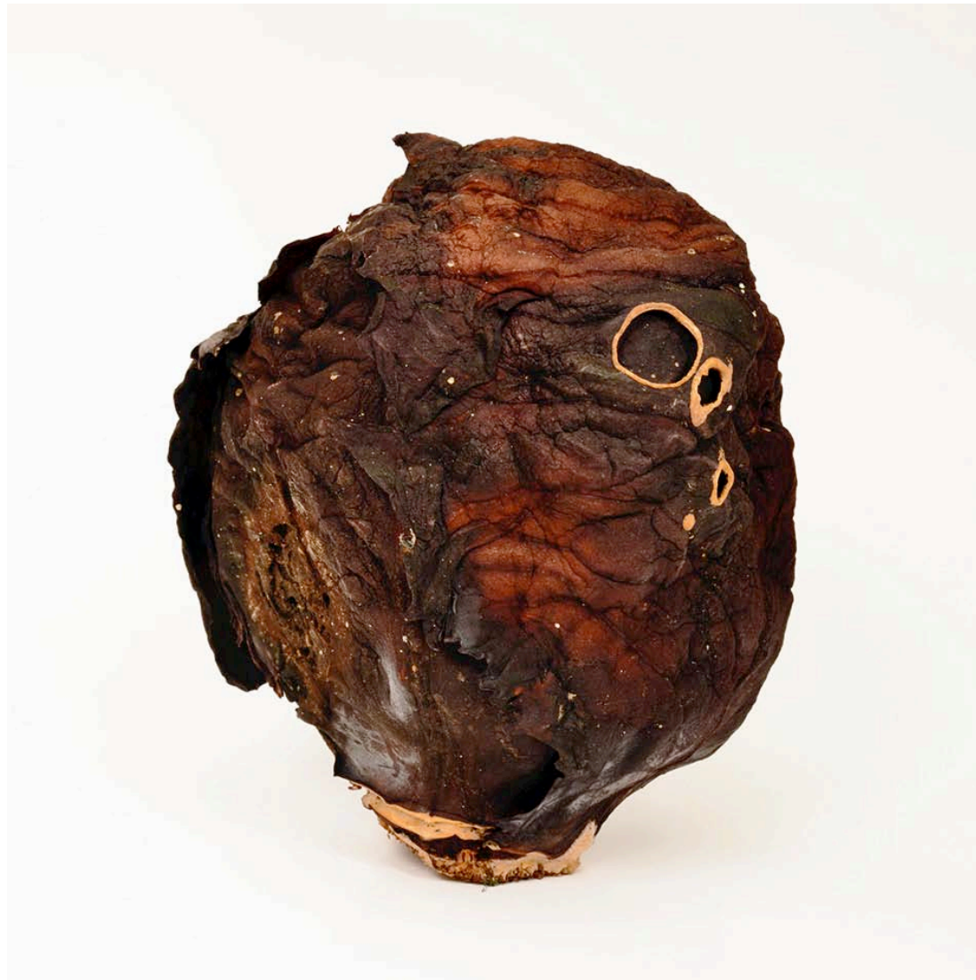
Choux rouge 2013 format (maxi 90 x 90 cm)