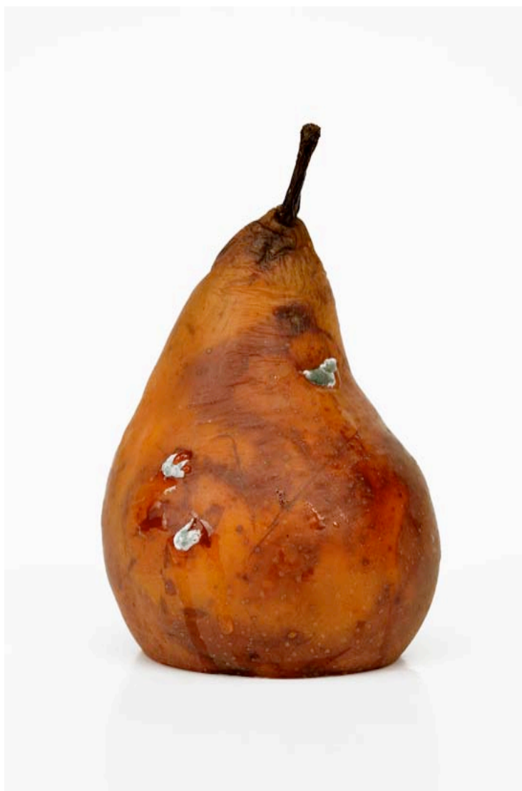
Poire 2015 format (max 90 x 60 cm)