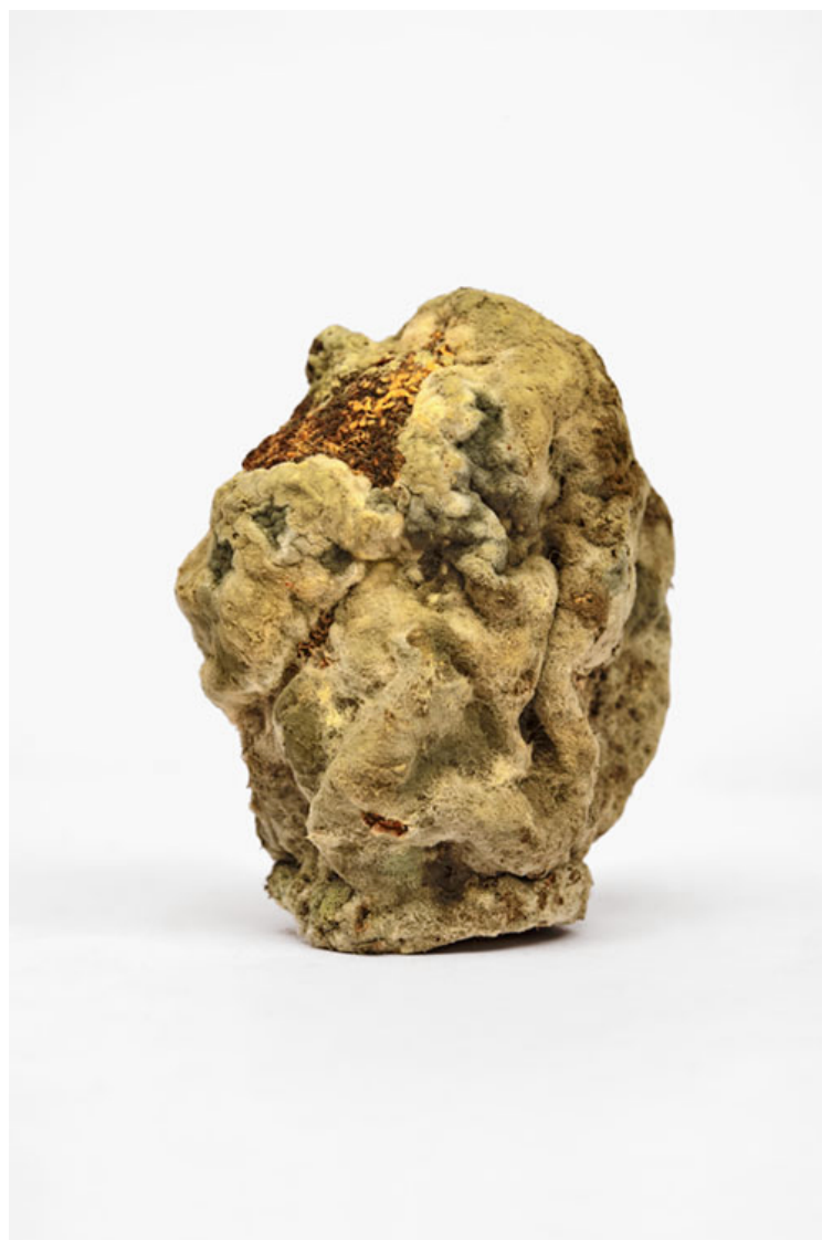
Citron 2016 format (max 90 x 60 cm )