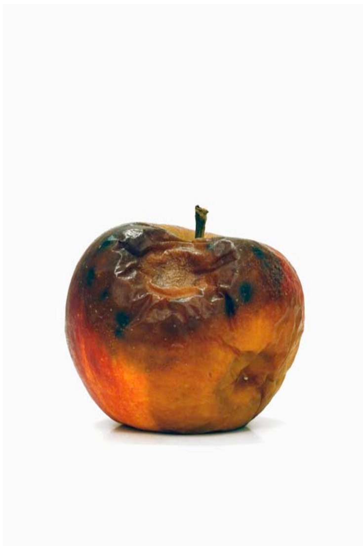
Pomme 2008 format ( max 90 x 60 cm)