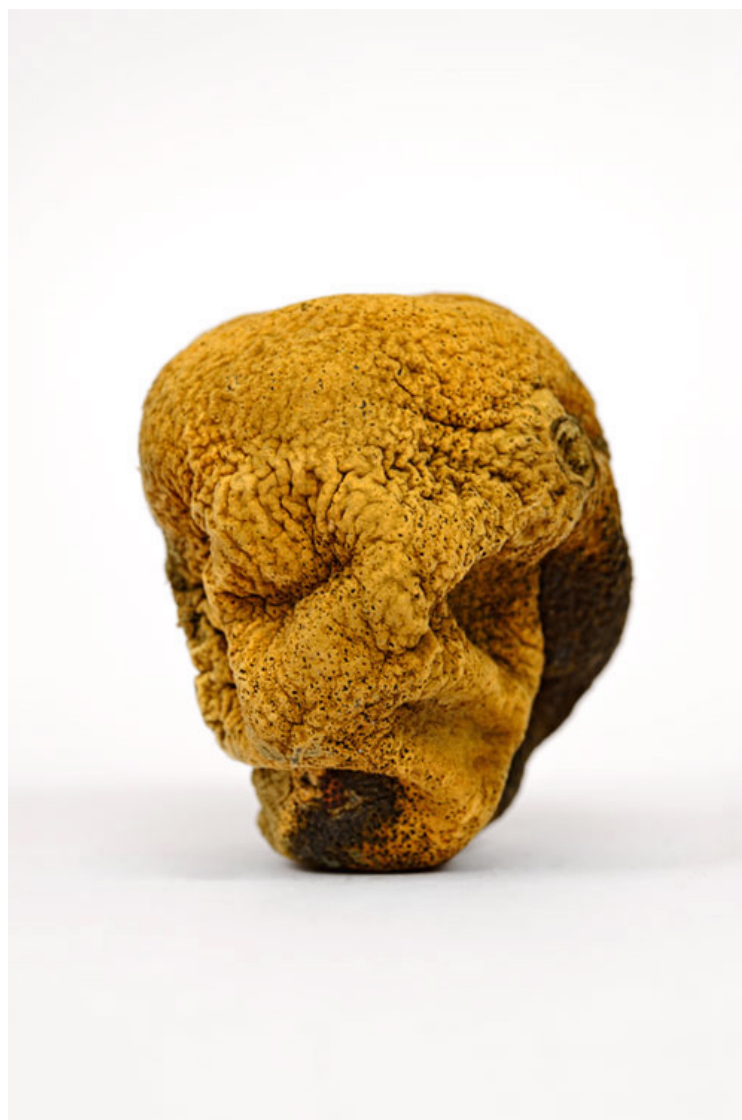
Orange 2016 format (max 90 x 60 cm )