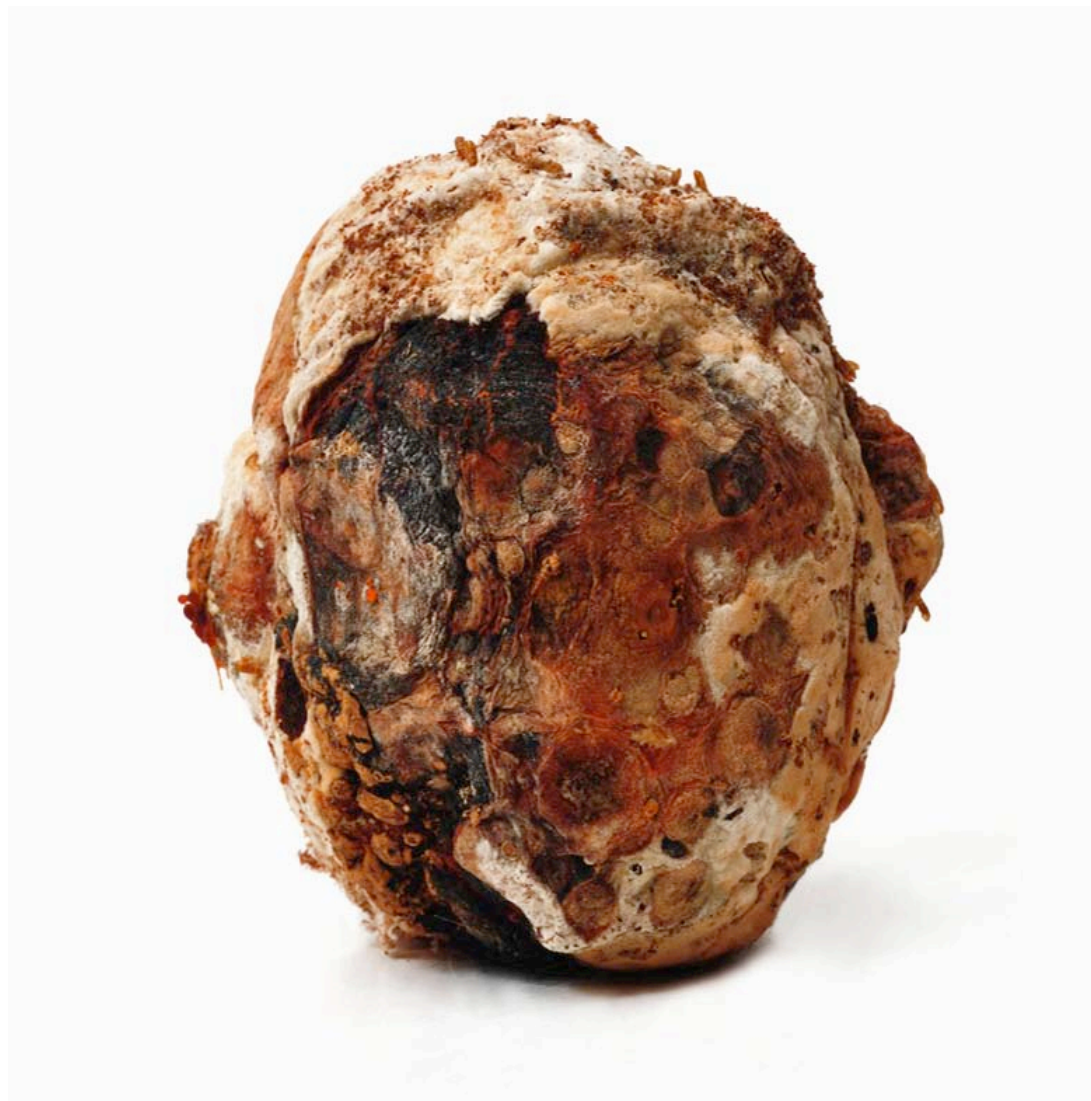
Potiron 2013 format ( 90 x 90 cm)