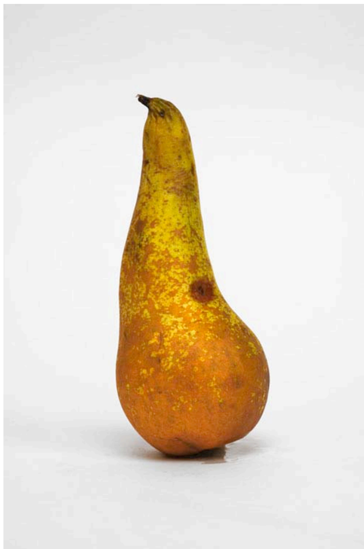
Poire 2016 format (max 90 x 60 cm )