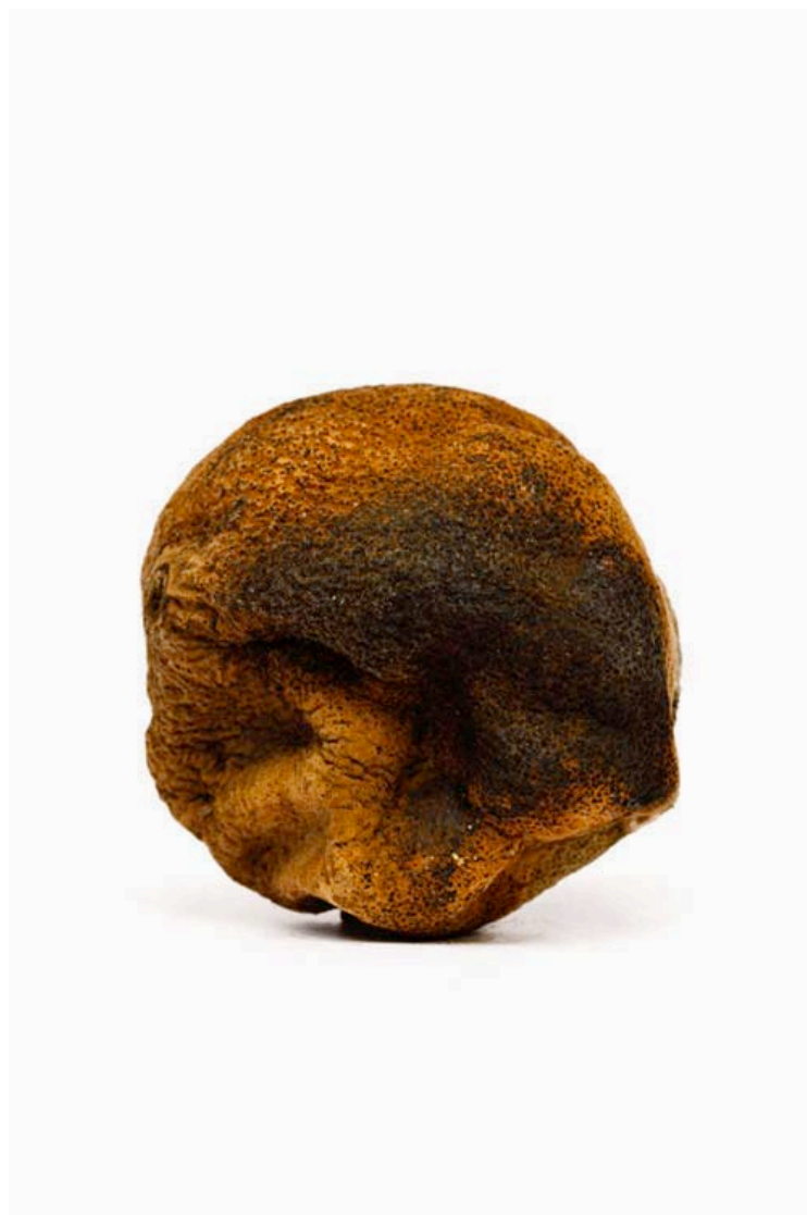
Orange 2016 format (max 90 x 60 cm )