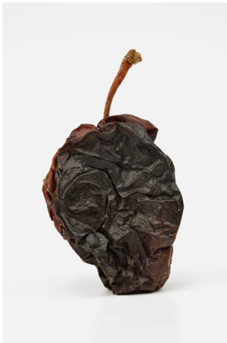
Pomme 2016 format (max 90 x 60 cm )