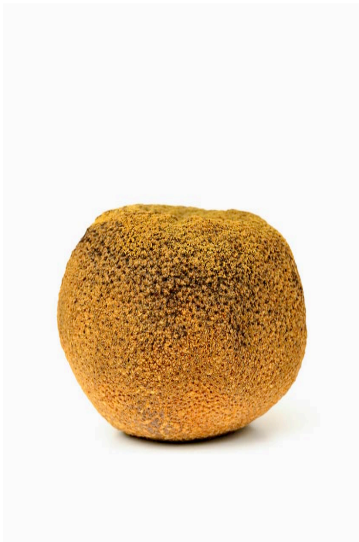
Orange 2015 format (max 90 x 60 cm )