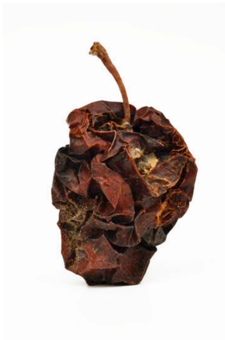
Pomme 2016 format (max 90 x 60 cm )