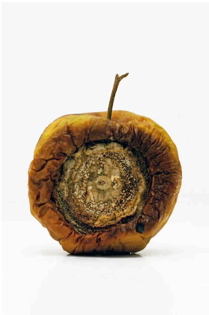
Pomme 2009 format (max 90 x 60 cm )