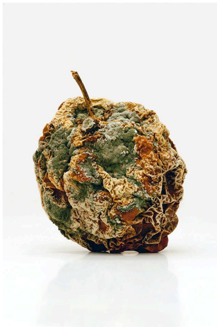
Pomme 2010 format ( max 90 x 60 cm )