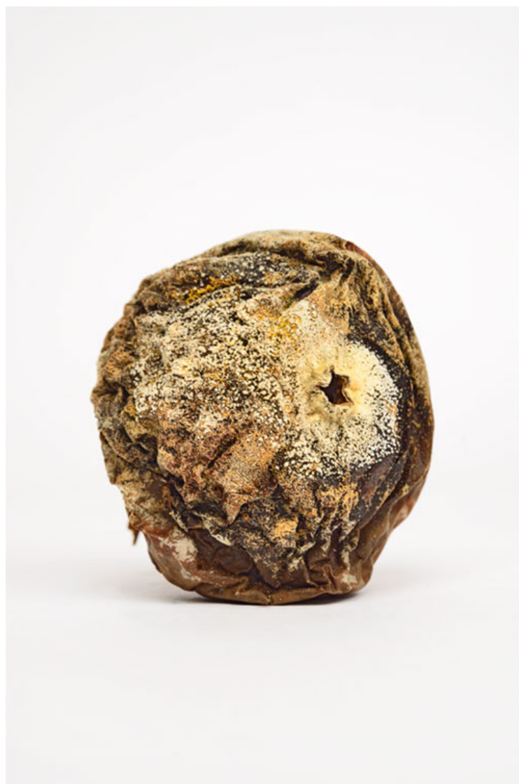
Pomme 2016 format (max 90 x 60 cm )