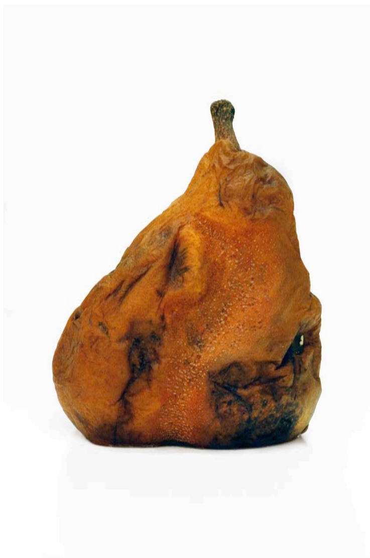
Poire 2009 format (max 60 x 90 cm)