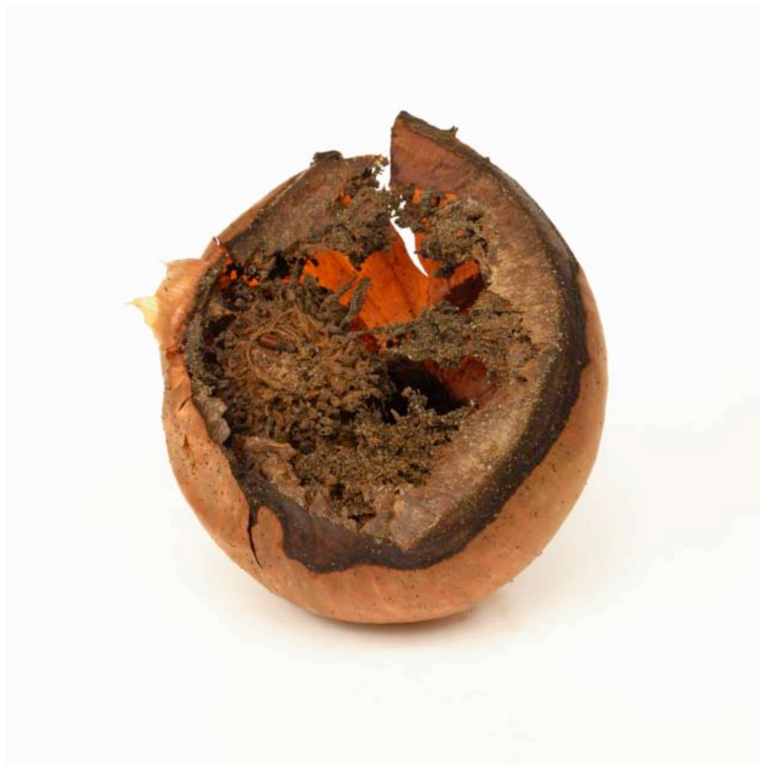
Oignon (vide) 2015 format (maxi 90 x 90 cm)