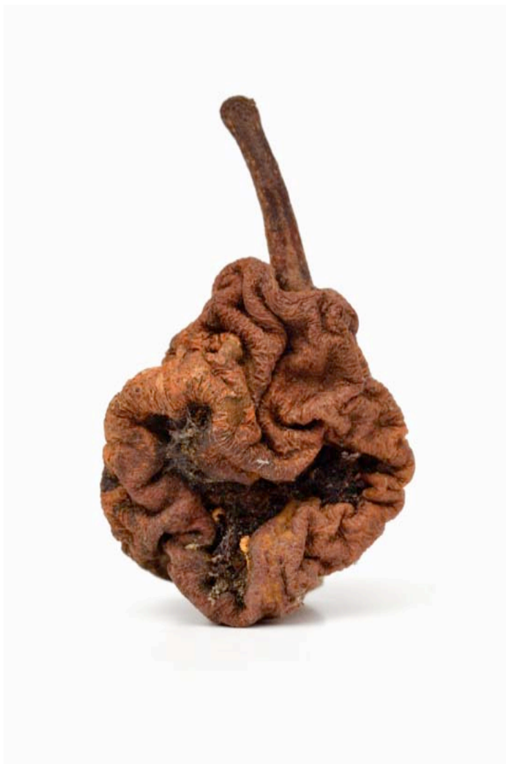
Poire 2015 format (max 90 x 60 cm )