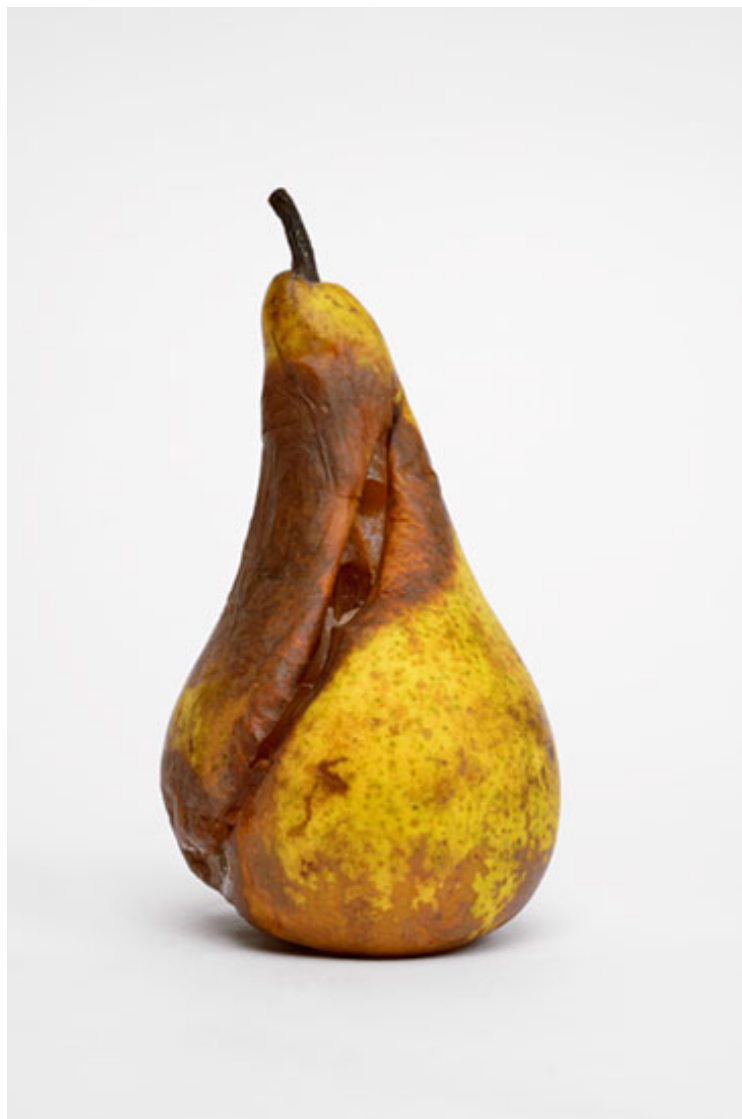
Poire 2016 format (max 90 x 60 cm )