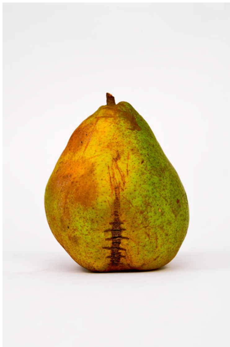
Poire 2016 format (max 90 x 60 cm )