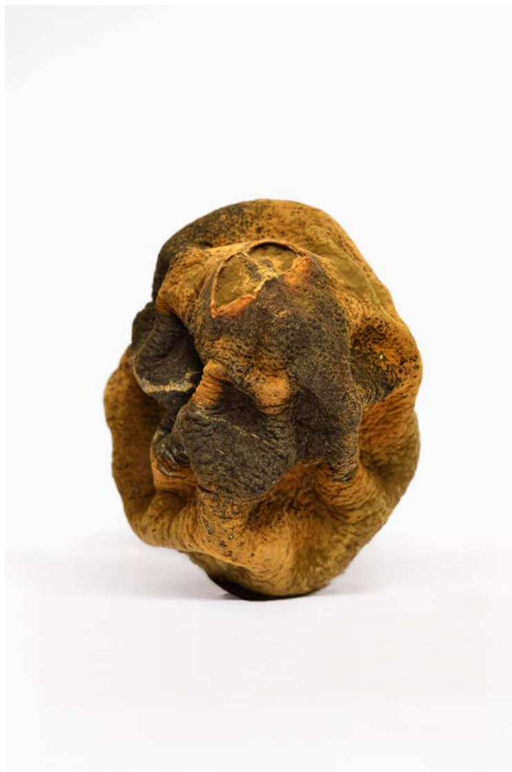
Orange 2016 format (max 90 x 60 cm )