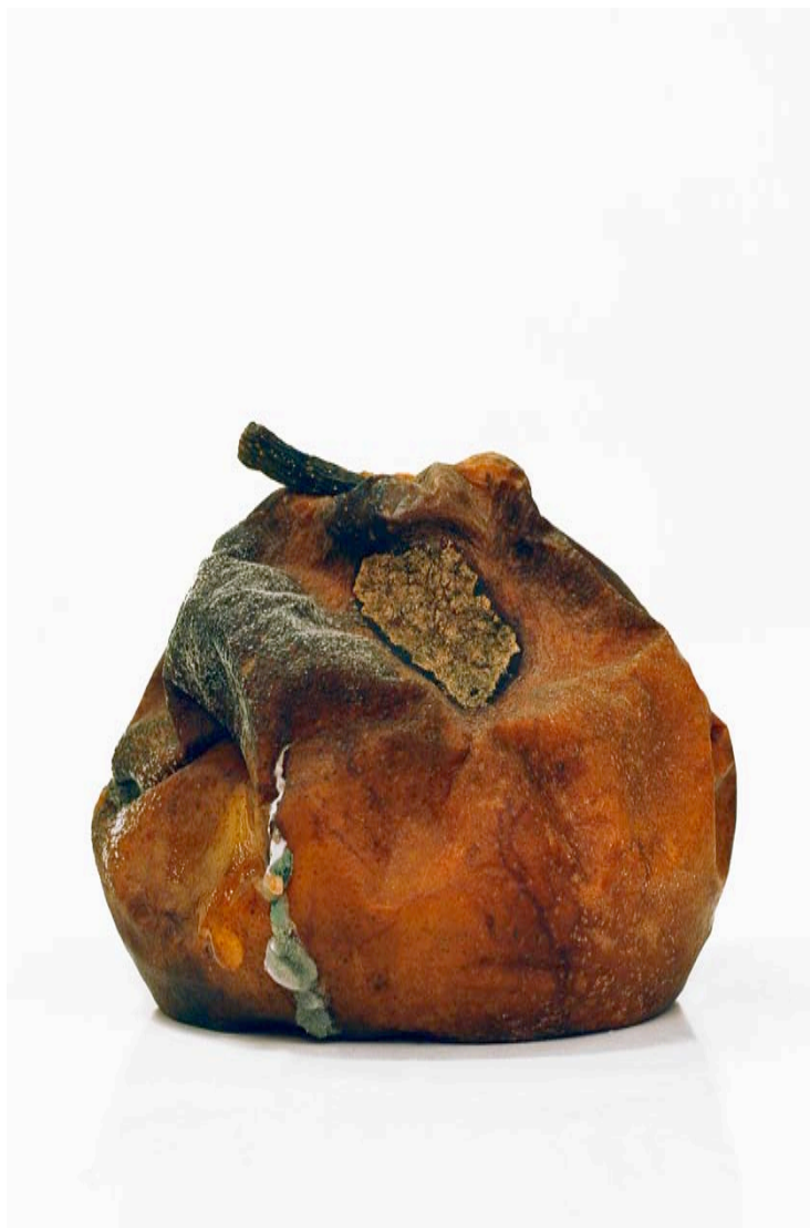
Poire 2008 format ( max 90 x 60 cm )