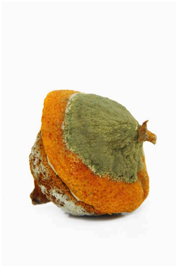
Citron 2013 format variable (maxi 60 x 90 cm)