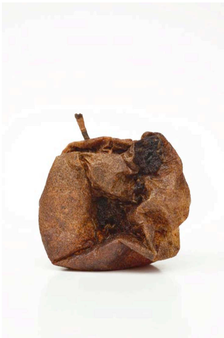
Pomme 2015 format (max 90 x 60 cm )