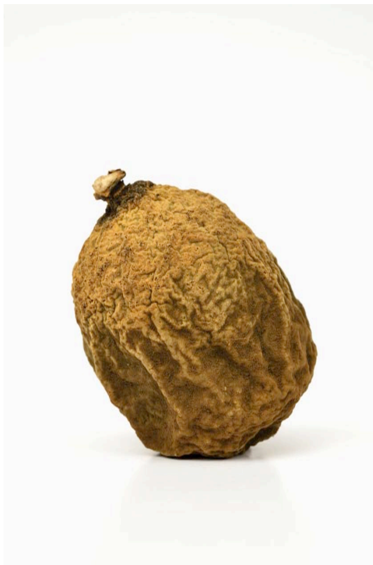
Citron 2015 format ( max 90x 60 cm )