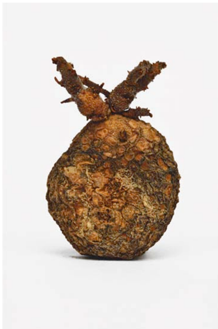
Pomme de terre 2015 format (max 90 x 60 cm )